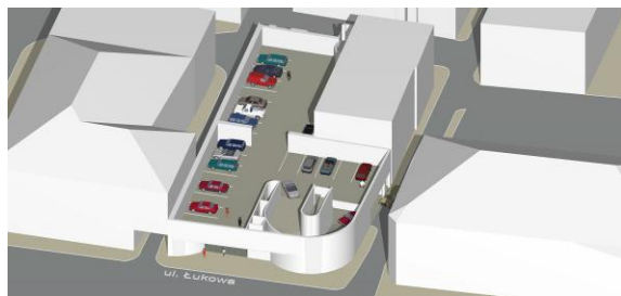
rzut I piętra – 26 miejsc parkingowych